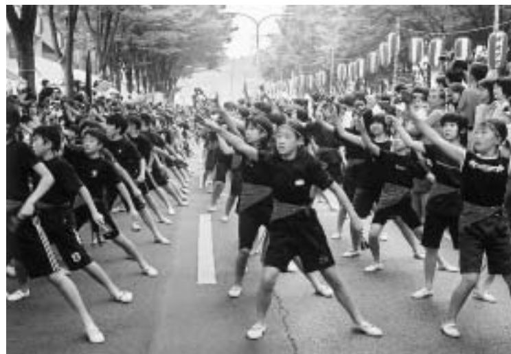
昨年行われた、鳴子おどり

18回目になる新松戸まつりが、今年も行われます。昨年は、25万人以上の人出でにぎわい、今年も100店以上のお店が出店します。