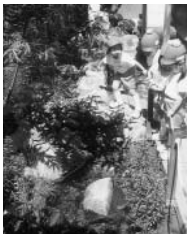
ホタルを育てる園児たち

ホタルを育てる園児たち をあげ、水や空気をきれいにすることの大切さを、ホタルを通して感じとったようでした。