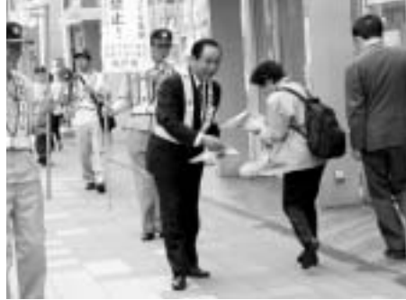
重点推進地区をピーアール（松戸駅西口）

アジサイの花が梅雨の雨に打たれ、いっそう鮮やかになってきました。5月末から6月にかけて、春の市民ぐるみでグリーンデーと江戸川クリン大作戦、江戸川松戸フラワールインでのコスモスの種まきなど、よりよい生活環境を築くための催しへ、多くの市民の皆さんに参加いただきました。 さて、6月3日、私は「松戸市安全で快適なまちづくり条例」における重点推進地区の一つである松戸駅周辺を、ピーアールも兼ねたパトロールしました。 条例が施行されて二カ月ほど経過したわけですが、たばこの吸い殻のポイ捨てや歩道に置かれた看板等が大幅に減少してきており、これも地域の方々や商店街のご協力のおかげ