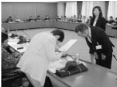
委嘱状を受け取る推進員の皆さん

市では、平成4年度から毎年度、市内12地区の町会・自治会に廃棄物減量等推進員(通称クリンクル推進員)を委嘱し、各町会・自治会内でのごみステーション利用者への指導等の、活動をお願いしています。今年度も、5月19日にクリンクル推進員の委嘱状交付式が行われました。