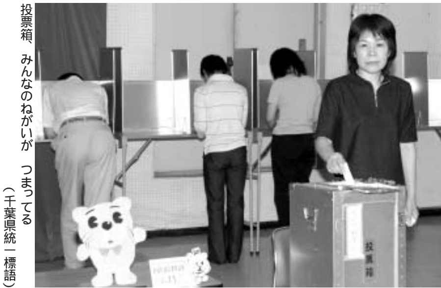
投票箱 みんなのねがいがつまってる (千葉県統一標語)