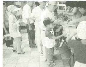
涼やかな音色を楽しみましょう

7月24日(木)、会場・時間は下記のとおり〔雨天決行〕持ち物虫かご(ビニール袋など飼育できないものは不可) 費用無料 ※1人当たりオス2匹、メス1匹を先着順に配布し、なくなり次第終了します。 團(株)まつど街と水辺の緑化基金 ☎345-9846