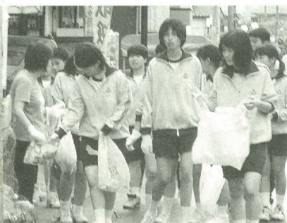
ごみ袋を片手に、学区内を回りました

6月12日、河原塚中学校の全校生徒による、地域の清掃活動が行われました。これは、地域の清掃活動を通して奉仕の心を育て、また、地域の人と連携した活動を行うことで地域との交流をより深めようという目的で実施されたもので、今回が初めてです。 授業終了後、校庭に集合した全校生徒四百六十人は、十七グループに分かれて、学区内の全地域に出発。 小雨まじりの天気でしたが、自分たちの暮らしている町をきれいにしようと、皆、一生懸命、清掃活動に励みました。