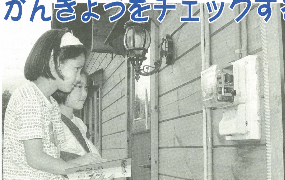
1週間で、電気をどのくらい使っているのかな？

市では小学生や中学生が、家族といっしょになって省エネや省資源に取り組める「かんきょうをチェックするノート」を作りました。4週間という短期間で、取り組みの成果が出せます。皆さんも夏休みに取り組んでみませんか？ 図環境計画課総務係 ☎366-7331