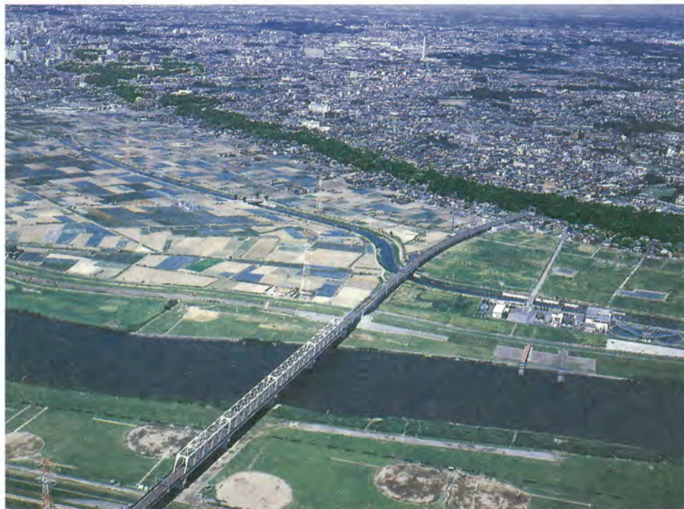
空から見た江戸川河川敷と矢切地区の斜面緑地帯（平成11年撮影）

発行：松戸市 編集：総務企画本部広報課 〒271-8588 松戸市根本387-5 TEL.047-366-1111 FAX.047-363-3200 e-mail mcity@intership.ne.jp URL http://www.intership.ne.jp/matsudo/