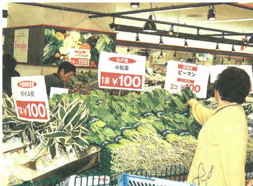
原産地などが一目で分かるようになりました(市内のスーパーで)