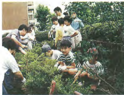
市民参加による植樹

応募資格：市内在住で、平日に会議に参加できる十八歳以上の 募集定員：六人以内 応募要項：市民・企業・行政が一体となって進める緑事業に関する三つのテーマ（①緑の保全 ②緑化の推進 ③緑の愛護団体）の中から関心のあるテーマを選び、意見（レポート）を原稿用紙一枚程度（約八百字）にまと