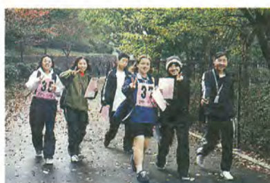
昨年11月に行われたウォークラリー大会で

ウォークラリーは、歩くことを通じて健康づくりやグループメンバーとのコミュニケーションを楽しむ野外ゲーム。交差点や分岐点だけを手がかりに、チェックポイントと観察ゾーンで出された問題を解きながら、未知のコースを制限時間内に歩きます。