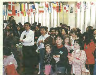
(財)国際交流協会の国際交流パーティーでも利用されています