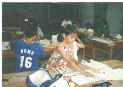
迷路の作図をする子どもたち(基本コース)

松戸少年少女発明クラブは、子どもたちに科学的な興味や関心を追求する心を持ってもらい、創作活動を通じて日常生活においても科学的発想を養うことを目的に昭和58年6月に設立された民間のクラブである。