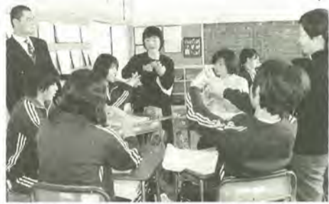
グループに分かれて個別の指導も行われました

小金中学校で1月30日に、地域の人を講師に迎えるなど学校を開放した「第二回ふれあいセミナー」が行われ、パソコン、農業体験、英・仏会話、音楽、工業、スポーツなど多岐にわたる講座が開かれました。