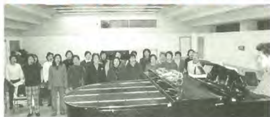
矢切女声合唱団の皆さん

矢切公民館を活動拠点とするサークルが、合同音楽祭を開催します。13回目となる今年の音楽祭には、16団体が参加します。その中の一つ矢切女声合唱団は、本番に向けて練習に励んでいます。