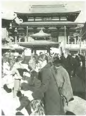
参加者総出のバケツリレー

もの冷たい北風が吹く中、幼稚園児の避難訓練や消火器を使った初期消火、参加した人々によるバケツリレーなどが行われ、暗れてはいないけれど、参加した訓練が行われました。