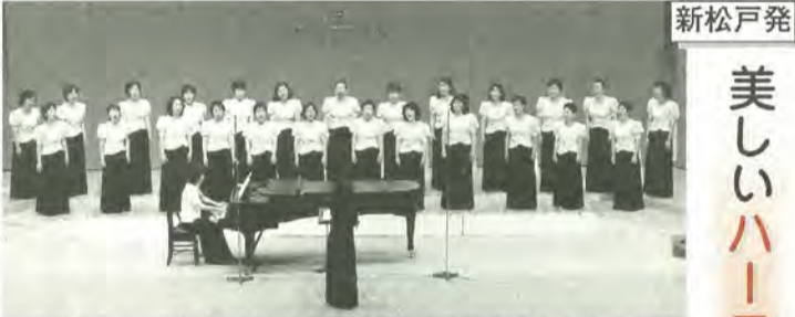
第54回千葉県合唱祭で歌う、新松戸コール・マミーの皆さん

同部会は、これまでも防災訓練・救急救護訓練など実施してきましたが、今回は昼間発生したとき女性や高齢者がどのように対処すべきか、講師を招いて開かれたもの。参加した80人は真剣な表情で、話に耳を傾けていました。