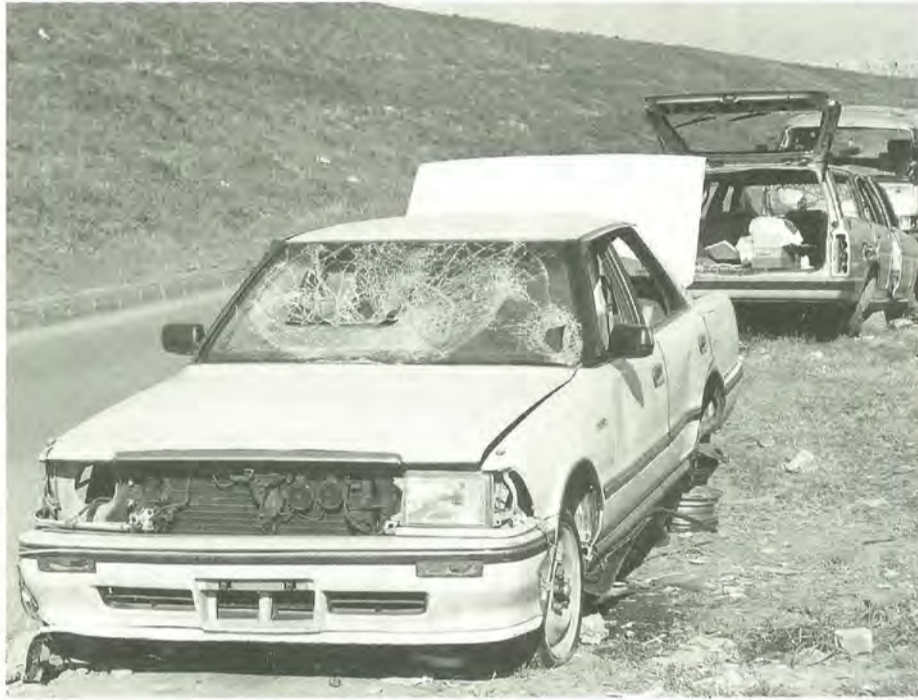
放置自動車は、周辺的美観をも損ねます