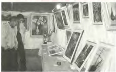
会員自慢の作品が展示されました

11月6日・7日の2日間、竜房台会館において竜房台自治会文化「作品展」が開催されました。作品展には、会員から写真・絵画・手芸・工作・趣味の収集品など多くの作品が出品され、みんなの目を楽しませてくれました。