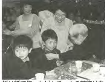
折り紙で作ったピカチュウの首飾りをプレゼント