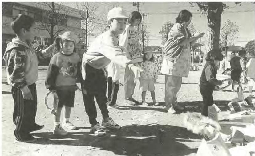
年齢の違うお友達とも仲良く遊びます（馬橋西保育所）

保育所はこんなところ 保育年齢 ：保育所によって異なりますが、0歳から就学前までのお子さんをお預かりしています。 保育時間 ：原則として午前8時30分～午後5時の間で、仕事などの都合で時間外保育を希望する人には、保育時間の延長を行っています。詳細は下表「保育時間」の欄をご参照ください。