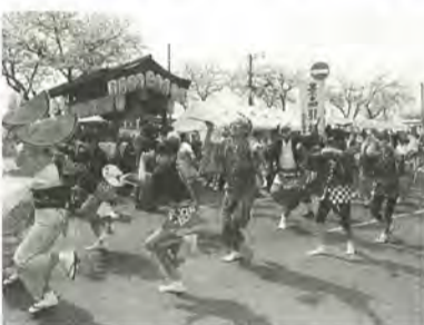
今年の六実桜まつり

◇六実桜まつりで披露◇ 練習日時…毎月第4木曜日午 後7時から 会場…六実市民センター別館 園柳田 ☎387-9789