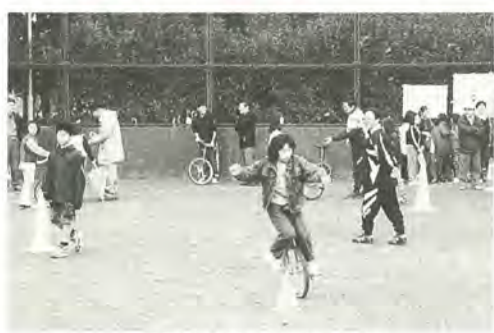
一輪車は子どもたちに大人気

11月7日、六実中央公園・六実市民センターを会場に「六実っ子まつり」が開催されました。このまつりは、地域のみながふれ合う場をと昨年から始められ、今年で2回目。あいにくの天気にもかかわらず、小・中学生を中心に多くの「六実っ子」が集まりました。