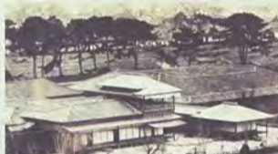
幕末二条城(徳川慶朝氏所蔵)

幕府の城が、新たな記録メディアである写真によってどのように記録されたのかを探ります。それらは写真によって捉えられた、生きて機能している城であり、幕末維新の大変革期における権力中枢の場の様相でもあつたでしょう。展示では、撮影の背景や必要性なども視野に入れつつ、終末期の幕府の城と黎明期の写真術の出会いによって残された写真の意味について考察してみたいと思います。