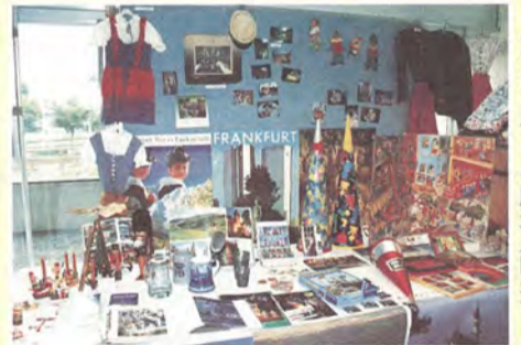
ドイツコーナーの展示（昨年）

ホール・ホワイエ…①草月流生け花の展示 ②世界の人形・おもちゃの展示（世界の民族衣装を着て記念写真を撮る（フィルム代実費）こともできます）