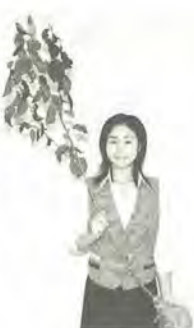
この桜の苗木をお分けします

市では、その桜の花を江戸川沿いに長期にわたり植樹し、「江戸川千本桜」という名所づくりを進めています。そこで、江戸川堤防周辺の敷地などに桜の苗木を植え、千本桜実現のため協力してくださる人に、桜の苗木をお分けします。