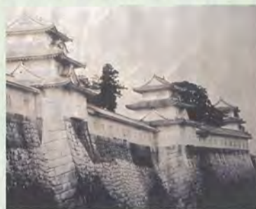
幕末大坂城(大阪城天守閣所蔵)

幕末、わが国に渡来した写真術という新しい記録メディアは、さまざまなものを絵画や絵図では不可能な精密さで記録していきました。肖像、名所、旧跡、演出を加えられた当時の風俗などが、印画紙上に焼き付けられていきました。