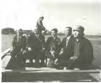
矢切の渡しの上で

松戸市の名前を全国的に広めた人を市で表彰することはできないのか。会合とか催しなどの場で、市民の皆さんからよく聞かれることがあります。松戸市には、こうした表彰制度がなく、私も、かねてから、プロ、アマチュアを問わず、松戸市の名声を高めた方や市民に夢や希望を与え