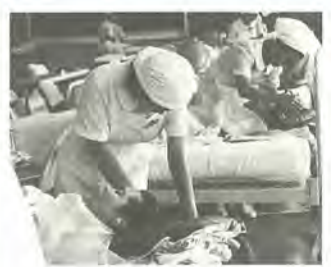
実習中の看護学生

平成12年度看護学生(看護科三年課程)を募集 願書受付期間平成12年1月11日(火)～14日(金)、午前9時～正午と午後1時～5時 試験日1月29日(土)(二次試験) 受験資格大学受験の資格がある人 募集人数四十人 ※入学案内(有料)配布中 1市立病院附属看護専門学校 ☎337・4444