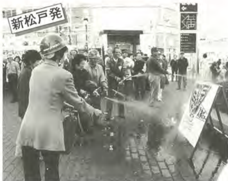
「火事だ」とみんなに呼びかけ初期消火

11月28日、ダイエー新松戸店前広場を中心に、新松戸町会・防犯協会ほか、多くの地域活動をしている団体等約三百人が参加し、防災・防犯のキャンペーンが実施されました。今回のキャンペーンは、災害や犯罪の防止のために阪神・淡路大震災での教訓を生かし、平常時、非常時の活動を地域が一体となって取り組んだもの。当日は初期消火訓練や起震車による地震体験と、防犯パトロールや啓発活動などが行われました。