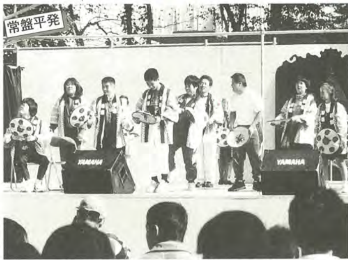
一生懸命に踊り、大勢の人から温かい拍手をもらいました