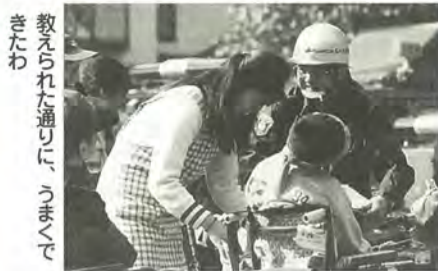
きたわ 教えられた通りに、うまく