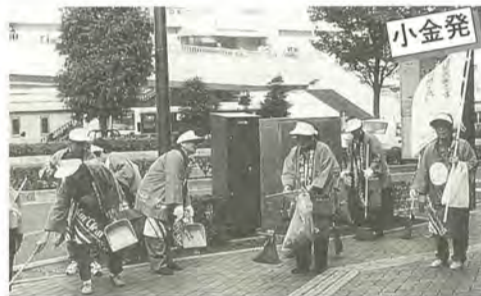
笑顔で清掃していました

同会では、住み慣れた地域の中で気軽に助け合える人間関係を一緒につくっていく会員を募集しています。 ☎さわやか福祉の会「松戸くらしの助っ人」☎340-3314番