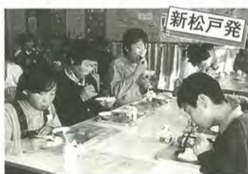
やっぱり自分たちで作ったお米はおいしいね

旭町小学校で11月24日に、「収穫を祝う会」が開かれました。この会は、食べ物を大切にしたいと3年前から行われ、毎年5年生が田植えを、2年生がサツマイモの植え付けを担当しています。今年白米80kg、サツマイモ735本がとれ、豊作を祝って全校生徒で食べました。