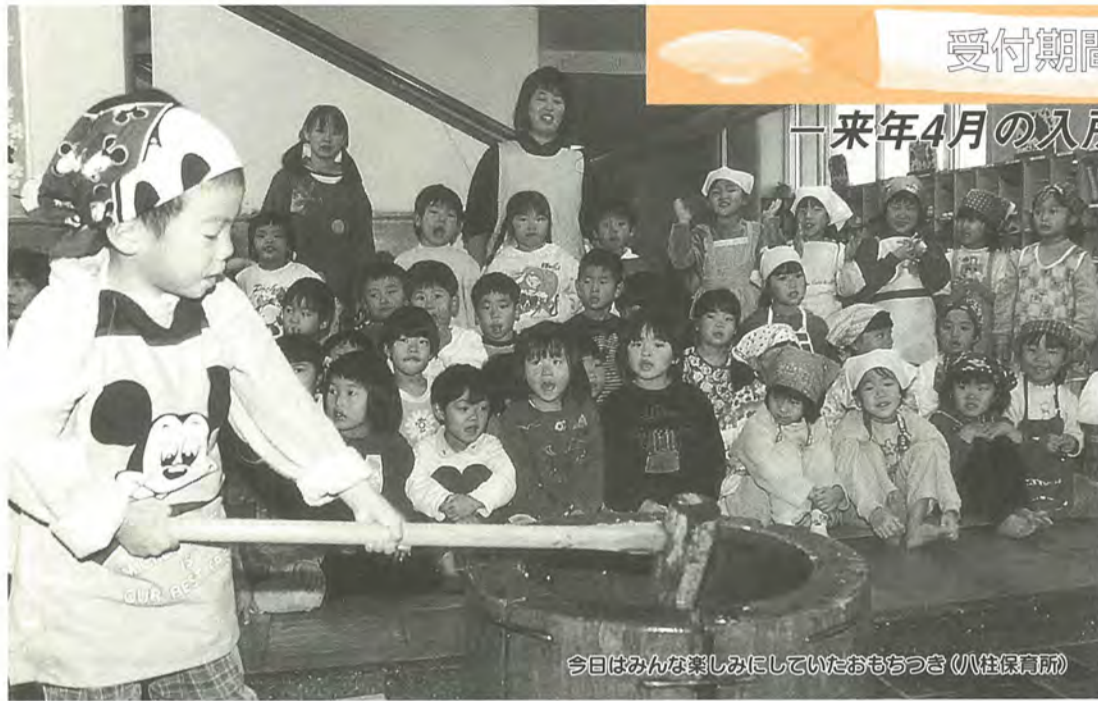
今日はみんな楽しみにしていたおもちつき (八柱保育所)