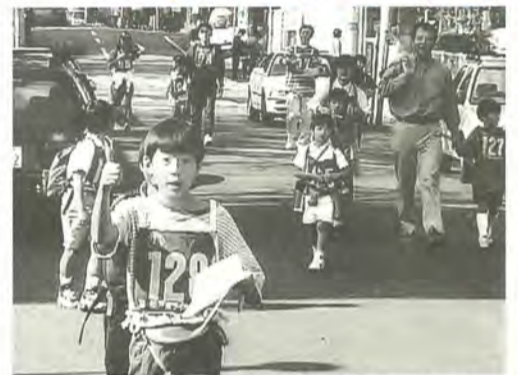
「今年は優勝するよ」と元気よくガッツポーズ

小金原地区の子ども会育成会と青少年相談員は、親子で楽しめるウォークラリー大会を11月3日に開催、約200人が参加しました。