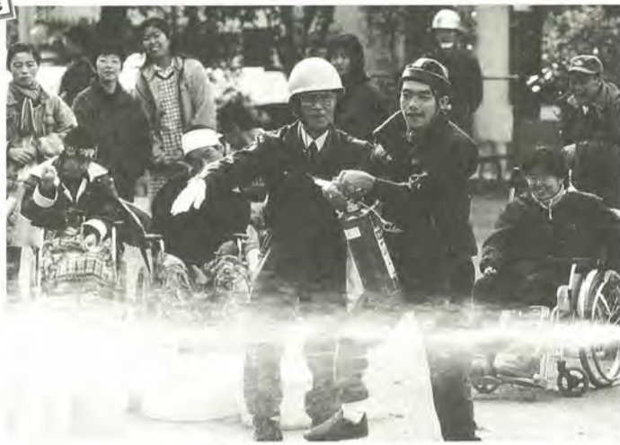
この火は、自分が消すんだ!