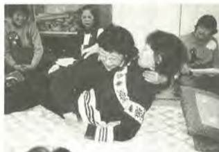
会では介護研修も行っています