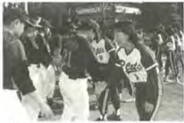
とてもすてきな試合でした

社会福祉法人松里福祉会(知的障害者への援助・啓蒙活動等を実施する法人)は、知的障害者施設わかば園を会場に、11月15日、民生委員や近隣に住むたくさんの人たち・高校生等の協力により「わかば祭」を開催しました。