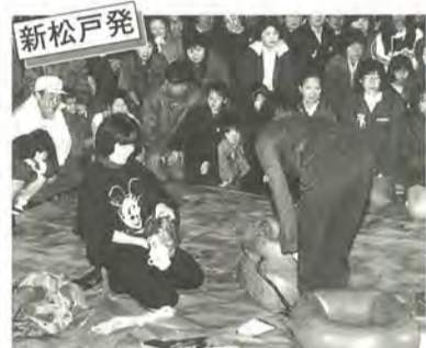
馬橋虹の街町会 初めての夜間防災訓練

馬橋虹の街町会で11月7日の夜、防災訓練が行われました。虹の街町会は昨年自主防災組織が結成され、夜間防災訓練は初めて。