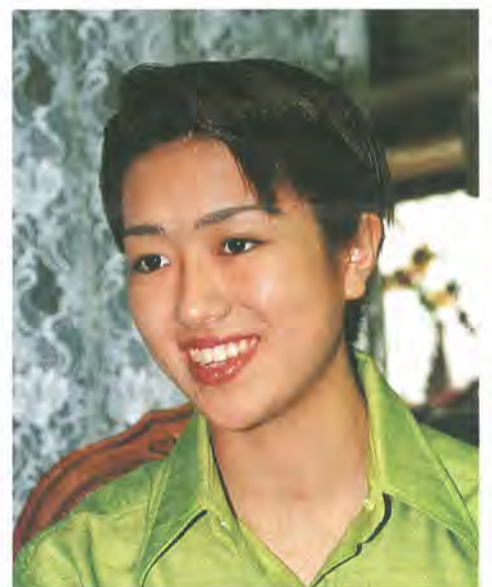
タカラジェンヌとしてデビュー

夏の間を終えて、次回の公演は11月28日(土)から東京有楽町駅前の一〇〇days劇場で行われる舞踏詩「浅茅が宿」とグラントレビユー「ラヴィール」。「スポットライトを浴びるとそれまでの震えは止まる。来てくれたお客様を夢の世界に誘い、頂いた役を精一杯やりたいという気持ちになる。そしていつかは存在感のある舞台人になりたい」と、希望を膨らませ、レッスンを励んでいける日はもうすぐだ。(松戸市出身)