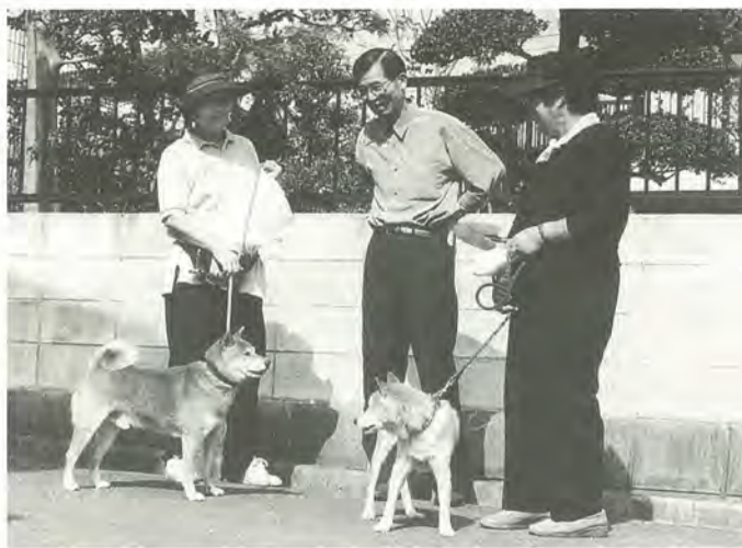
ペットは地域の交流にも一役。マナーを守って気持ち良く

犬や猫などのペットを飼うことは、本来、私たちの生活に潤いや安らぎを与えるものですが、飼い方を誤ると周りの人に迷惑を掛けたり、危害を及ぼすことがあります。だれもが気持ち良く生活できるよう、飼い主の責任ある対応が求められています。