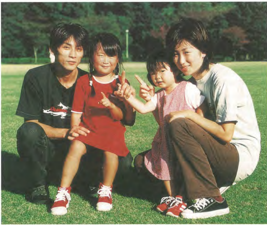
私たちの代表を決める一票だから大切にしたい