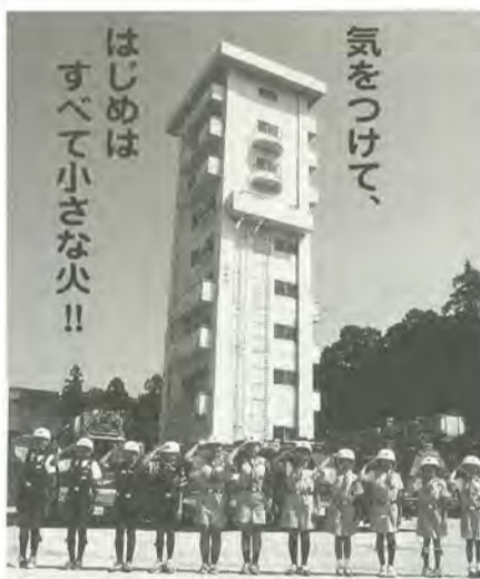
松戸市消防局 松戸市消防団 松戸市防火協会 松戸市危険物安全協会 松戸市幼少年女性防火委員会 火災予防を呼びかけるポスター。モデルは「松戸市少年消防クラブ」の皆さんです