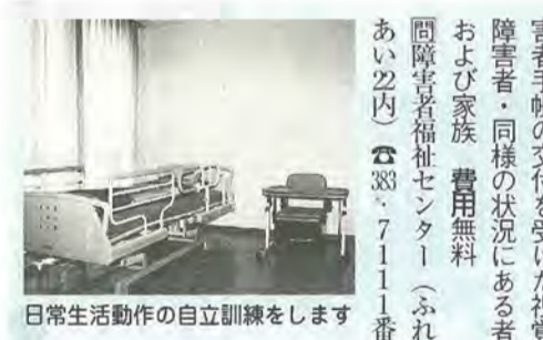
日常生活動作の自立訓練をします

●自転車駐車場の整備事業に補助金を交付します 通勤・通学者を対象とした民間自転車駐車場の新設、増設および改修に係る事業(鉄道事業者等が実施するものを除く)に要する経費に対し、補助金を交付します。 補助対象要件：鉄道駅からおおむね三百メートル以内またはバス停留場からおおむね二百メートル以内の市長が整備を必要と認める地域内で、収容台数が自転車でおおむね五十台以上の事業 補助金額：建築工事費等で市が認める経費の約三分の一(上限一千万円)