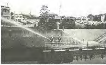
坂川の多目的護岸で行われた放水訓練

今年には例年になく長梅雨で梅雨明け後も雨の日が多く、農作物への影響が心配されます。