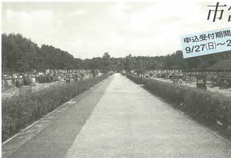
周辺は山に囲まれ、四季おりおりの風情があります

焼骨保有者(2親等以内の焼骨を保有し、かつ埋火葬許可証の原本を保有している人で、焼骨を5年以内に埋蔵できる人)には153区画、焼骨保有者以外の人には20区画を募集します。 園緑地管理課白井聖地公園係 ☎366-7379番