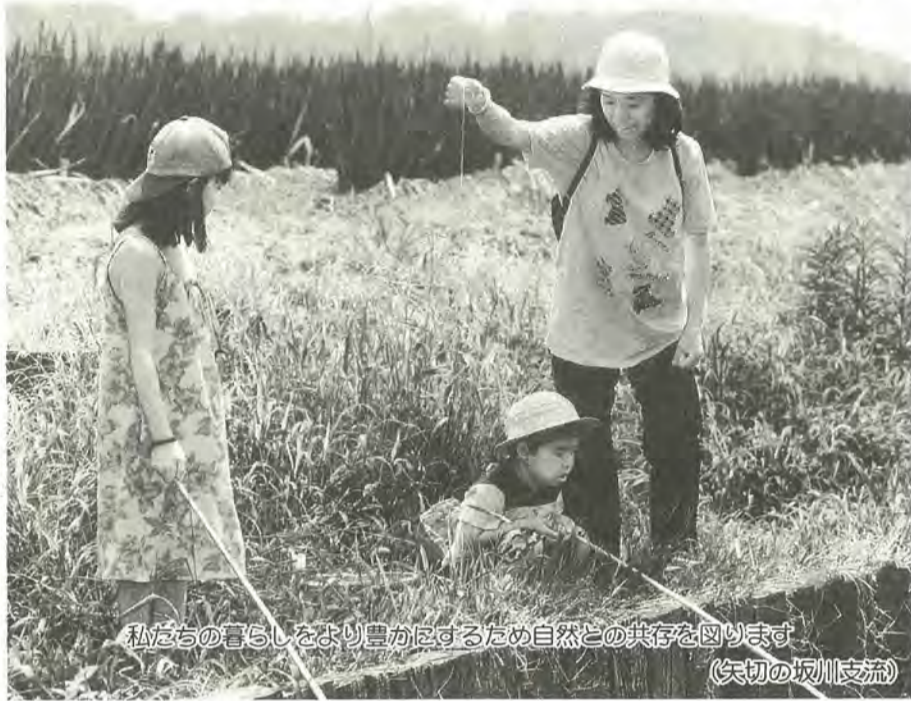
私たちの暮らしをより豊かにするため自然との共存を図ります (矢切の坂川支流)

近年、温暖化・酸性雨などの地球環境問題やごみの大量廃棄・河川の水質汚濁などの都市生活型の環境問題が大きな社会問題として関心が高まっています。市ではこうした社会状況の中、将来の松戸市はどうあるべきか、そして私たちは何をしなければならないか、その方向を明らかにするとともに、市民のみならず事業者、行政が一体となって環境づくりを進めるための指針として、「松戸市環境計画」を策定しました。その概要をお知らせします。