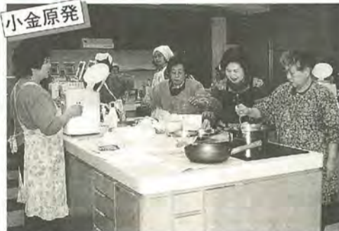
料理教室の調理機器はすべて電気のため、安心して利用できます。食器や食卓もあり利用者にも好評です

東京電力(株)松戸営業所(小金原1丁目19の2)では、地域のふれあいの場として、コミュニティーホール(90人収容)やオール電化のシステムキッチン等を備えた料理教室を貸し出しています。会合や講演会、サークル活動にご利用ください。