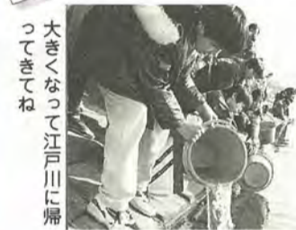
大きくなって江戸川に帰ってきてね

2月27日、子どもたちが、サケの稚魚3万6千匹を江戸川に放流しました。稚魚は、松戸中央ライオンズクラブが市内の公立小中学校に配った受精卵がかえったもの。