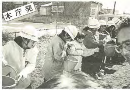
声を掛け合い、素早くリレー

阪神・淡路大震災後、市内各地域で防災意識が高まり、次々と自主防災組織が結成されています。