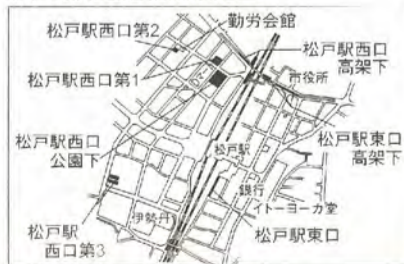
松戸駅周辺駐輪場案内図