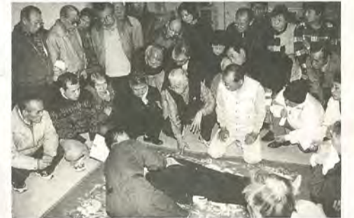
真剣なまなざしで消防職員の指導を受ける参加者

万一の際、最初の5分間の応急処置が救命率を左右することから、研修では気道の確保や人工呼吸、心臓マッサージなどの心肺そ生法を、ダミー人形を使って体験。参加者は「いざというときに適切に対処するには、体で覚えなければいけませんね」と応急処置の大切さを痛感するとともに、心肺そ生法の習得に意欲をみせていました。