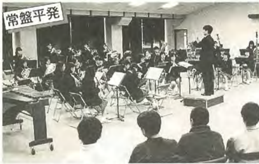
卒業おめでとうと演奏する吹奏楽部

2月21日、卒業する地元の松飛台小学校6年生に、県立松戸国際高校吹奏楽部の皆さんが、卒業記念コンサートをプレゼント。