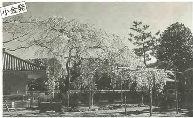
満開の花の下で桜色の春を感じませんか

春の訪れを告げる桜。今年の開花は、例年より早いといわれていますが、東漸寺境内(JR北小金駅南口から旧水戸街道を南へ約400m)にあるしだれ桜が、もうすぐ開花を始めそうです。