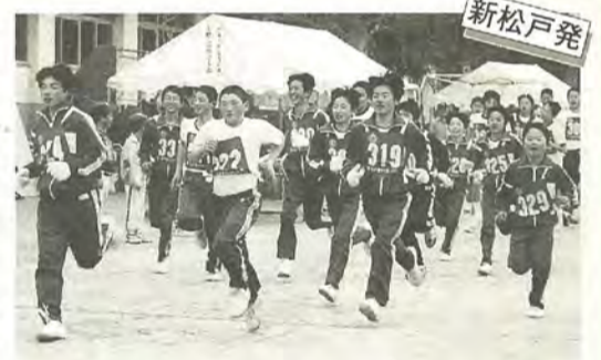
さわやかな汗を流し、全員元気よく完走しました