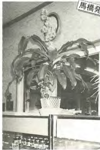
パンを焼く炉で1年中暖かい店内は、熱帯育ちの幸福の木に居心地がよかったようです

青少年相談員連絡協議会新松戸支部主催による「第16回新春マラソン大会」が、参加者226人を集め、2月8日に行われました。