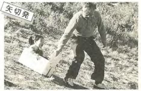
ほのぼのとした光景は、心も温かくなります

良く晴れ渡った午後、江戸川の土手へ行ってみると、たんぽぽの花が咲いていました。いつものまにかもう春なのです。 温かな日差しに誘われて、家族のたんぽぽがあちこちから見られました。外で遊ぶのはとても気持ちがよいのか、子どもの喜ぶ声も聞こえました。 日たまりの中での心地よい時間でした。