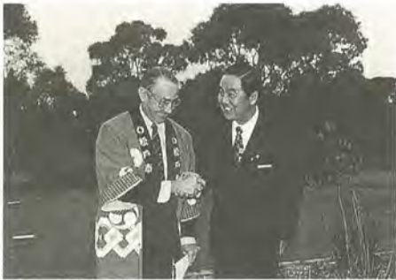
ジェフリー・オスカー氏(ホワイトホース市長)と今後の交流を誓って握手をする川井市長

昭和46年5月、ユーカーの本が取り持つ縁でオーストラリアのポックス・ヒル市と姉妹都市の提携を結び、今年で二十五周年になります。