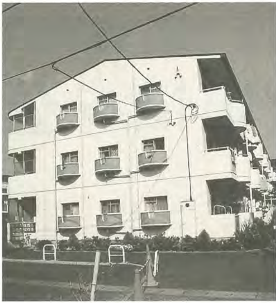
松戸新田第二住宅

入居資格 ：①平成7年6月25日(シルバー中金杉を申し込む人は平成5年6月25日)以前に住居登録をし、現在も市内に居住している、または、同日以前から市内の一定の勤務場所に勤務している②現に同居し、または同居しようとする親族(事実上婚姻関係と同様の事情にある人、婚姻の予定者を含む)がいない③年間総収入が別表1・2の収入基準に該当する「ただし、一人以上の収入がある世帯・寡婦(夫)控除・身障者控除の対象者のいる世帯については、金額が変わります」④現に住宅に困窮していることが明らかでない