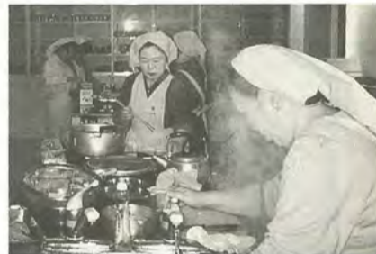
健康を考えた料理に取り組んでいます

栄養改善推進員は、市から委嘱を受け、食生活改善活動を進めています。活動内容は、学習したことをもとに、地域で健康を考えた簡単にできる料理教室を開催したり、献立やリフレットの配布、市の事業へのお誘いを行っています。 食生活に関心のある人、お気軽に声を掛けてください。 ☎中央保健センター ☎66・7490番