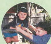
公園で遊ぶ子供たち