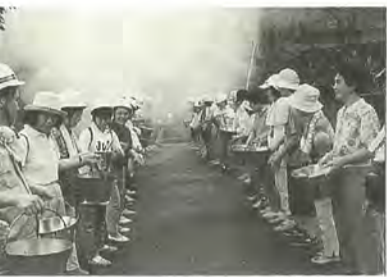
いざというときに備えて

常盤平で、植樹樹(ます)を花で飾る運動が盛んです。はなみずき通りでは、双葉町町会が五年前から取り組んでいます。除草の後、そのままでは寂しいので、花を植えたのが始まり。ひまわりなども植えました。色合いと丈の高さから、チューリップが一番好評とか。