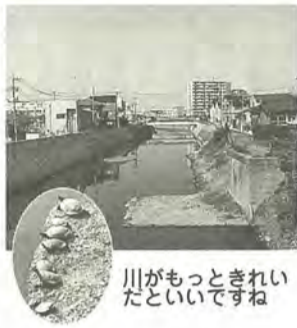
川がもったいなくてきれいだ