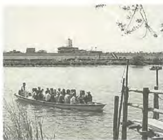
風が気持ちよく感じます

矢切と葛飾柴又を結ぶ江戸川の矢切の渡しは、ゴールデンウィーク期間中好天に恵まれたこともあって、大勢の人でにぎわいました。