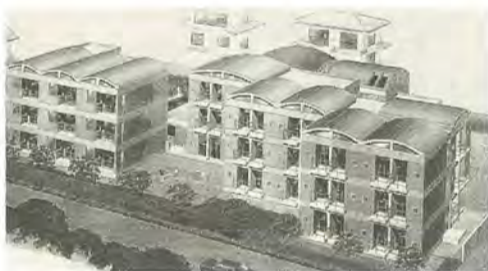
国際交流をもっと身近なものに

大学の学生課でも、今後、市のイベントに参加したり、市民との交流を積極的に行いたいと話しています。