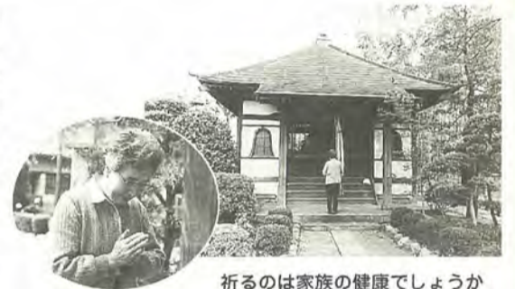
祈るのは家族の健康でしょうか