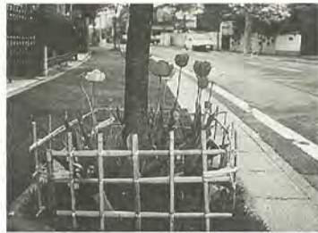
緑豊かな街づくり