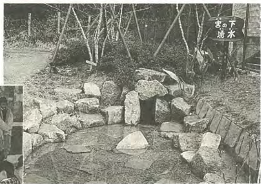
▲貴重な湧水を大切にしたいですね

春の草地で三枚の葉がじゆうたんのように広がっています。これが、ヘビの出そうなところに生えるといわれるヘビイチゴです。 春の訪れとともに鮮やかな黄色い花が開き、五枚の花びらは春の日差しをいっぱい浴びて笑っているかのようです。 初夏のころ、まんまるの赤いイチゴができます。毒々しく見えるので、ヘビが食へるとか、毒があるとか言われてきましたが、おいしくないので無害です。 ※「みどりの歳時記」は今回で終了します。ご愛読ありがとうございました。