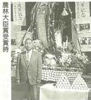
農林大臣賞受賞時

このコーナーに掲載する「思い出」を募集しています。お話を聞かせください。園広報課