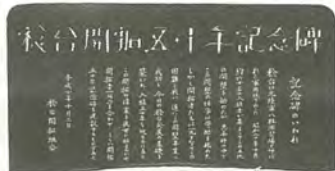
表面には開拓者60人の名前が刻まれています

9月24日、森のホール小ホールで稔台開村50年を祝い、稔台の人たちの手作りによるミュージカル「稔台ものがたり」が上演されました。