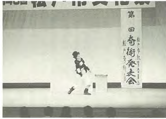
昨年行われた奇術発表会