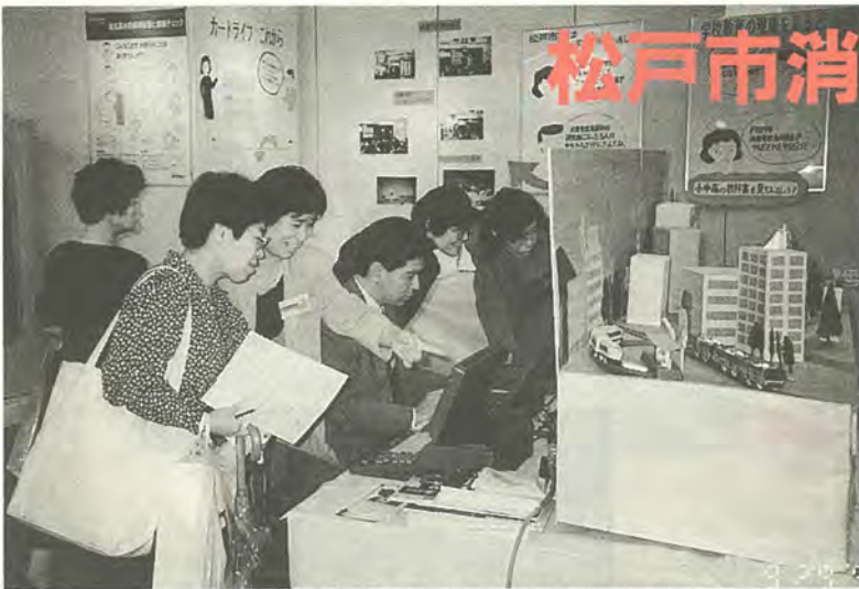
身近な生活情報が盛りだくさん(昨年の消費生活展)