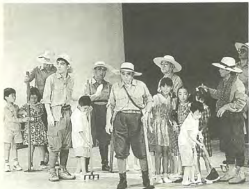
拍手かっさいのミュージカル

馬橋北小学校人形劇団「クラブトトロ」による「プレーメンの音楽隊」の上演では、小学生の熱演に会場から盛大な拍手が送られていました。訪れた人たちも参加した人たちも、それぞれにおはなしフェスティバルを満喫した2日間になりました。