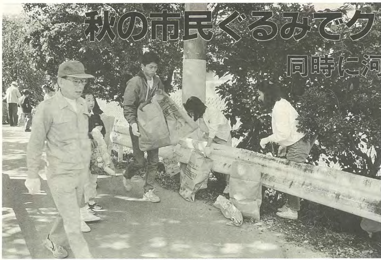
街をきれいにするのは、私たちの手で