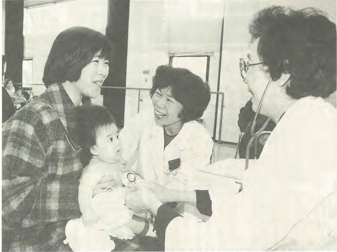
予防接種の内容をよく理解し、子どもの健康状態をみながら受けることになりました

昨年10月の法改正により、4月1日から予防接種の制度が変わります。 これまで予防接種は、病気がまん延するのを防ぐために接種が義務づけられていましたが、これからは個人の病気を予防するため、予防接種について十分理解したうえで受けることとなります。 また、予防接種の対象となる病気が変更されたほか、対象年齢も引き上げられました。 保健衛生課予防衛生係 ☎66-74833-4番