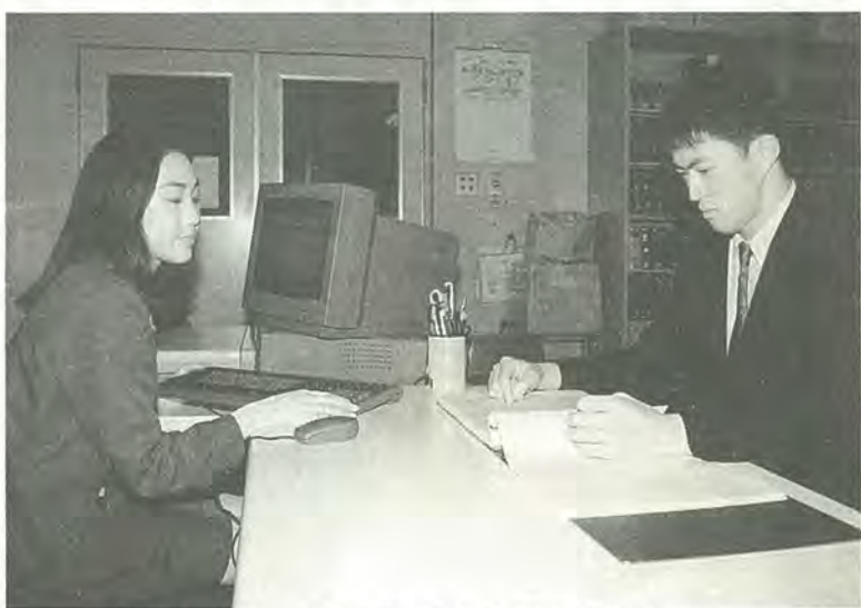
職員が請求する公文書を特定するためのお手伝いをします

制度を実施する機関：市すべての機関(市長・教育委員会・選挙管理委員会・公平委員会・監査委員・農業委員会・固定資産評価審査委員会・水道事業管理者・病院事業管理者・消防長・議会)