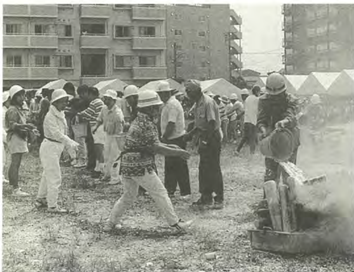
昨年行われた防災訓練の様子

火災件数は22件増加 昨年一年間の松戸市の火災 は百八十六件で、一昨年に比 べて二十二件の増加となりま した。また、過去五年間の平 均百八十一件をも上回りました。 火災の原因は下表のとおり となっております。