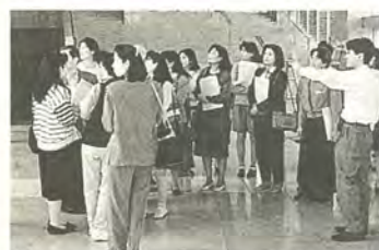
森のホール21を見学するモニターの皆さん

消費生活モニター制度は、消費者の意見を市政に反映させるための制度です。 また、モニターになると、消費者としての知識を高めることができます。 あなたも消費生活モニターになってみませんか。 モニターの仕事 ①消費生活に関する問題・意見・要望の提出 ②研修会・市内(外)施設見学会への参加 ③計量調査・量目試買検査の実施 ④テーマ別グループ研究(平成6年度のテーマ「牛乳パックの表示・リサイクル・高齢者の生きがい・家計管理」) ⑤アンケート調査の回答 ⑥地域リーダーとしての活動(地域の消費者に対する啓発活動) 募集要領 対象：市内在住の二十歳以上で、平日の活動が可能な人三十人 任期：4月1日から一年間 謝礼：年額二万円程度 ③3月7日(火)までに、電話で消費生活課消費生活係 ☎661-7329番へ