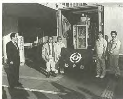
市役所を出発する給水車を見送る

橋脚ごと横倒しになった 高速道路、傾いたビルや崩 れ落ちた家、あちこちから 上がる火の手、恐怖と不安 の表情、テレビが映し出す 画面は、にわかには信じが たい惨状でした。