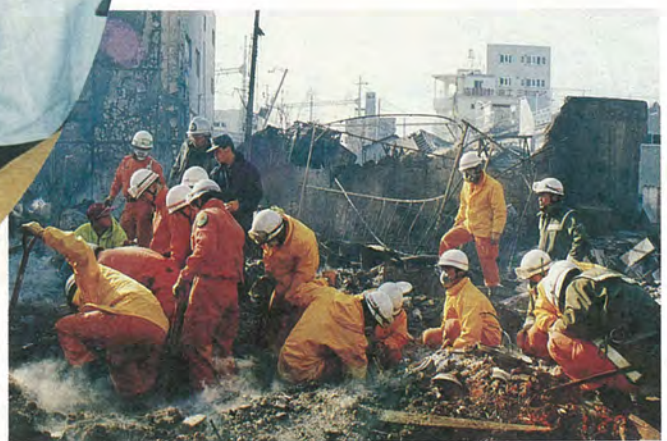
消防局からは、14人の救助隊が出勤。約1週間にわたって救助・ 捜索活動などを行いました。

1月17日に発生した阪神大震災(兵庫県南部地震)は、五千人以上の犠牲者が出る大災害となりました。 市では、救助・医療救護・避難所支援などに市職員を派遣したほか、災害非常用給水車やごみ収集車も出勤。再生自転車や備蓄食料などの救助物資(乾パン・ビスケット各一万食、アルファ米千食、飲料水二万缶)を送り、義援金の募金活動も行っています。 市民の皆さんに、市の救援活動の状況をお知らせいたします。