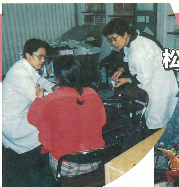
キャンピングカーに泊まりながら医療活動 市立病院の医師・看護婦など延べ23人の医療スタッフが、 神戸市東灘区で被災住民の救護活動に当たっています。