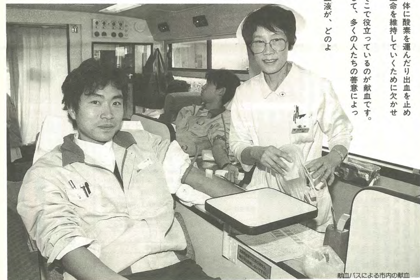
献血バスによる市内の献血

あなたの血液を大切に使うために 輸血といえば、昔は血液の全成分をそのまま輸血する「全血輸血」がほとんどでした。しかし、医学の進歩に伴い、献血された血液を赤血球、血しょう、血小板などの成分に分けて輸血する「成分輸血」ができるようになりました。これは輸血による感染症への感染や、副作用を大幅に軽減できます。さらに貴重な血液を無駄なく利用することができるようになり、現在では成分輸血が主流となっています。