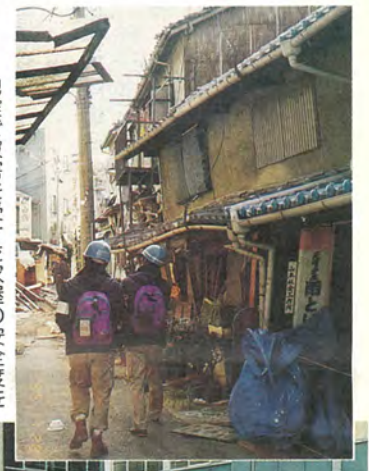
地震で被害を受けた家屋の安全度を調査する市建築指導課の職員

現在、市内にお住まいの被災者で、①身内に死亡者、行方不明者がいる②住宅が全壊、全焼している③住宅が半壊、半焼しているのいずれかに該当する人は、災害見舞金を受けられる可能性がありますので、ご連絡ください。 ☎日本赤十字社千葉県支部救護福祉課 ☎043-241-7531番