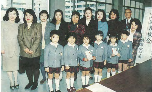
子どもたちも義援金に協力

市では、義援金受付本部を設置し、4月14日(金)まで援護課と各支所の窓口で、義援金の受け付けを行っています。 これまでに皆様から87,476,556円(2月9日(休)現在)の義援金をお寄せいただきました。ありがとうございます。 集められた義援金は、日本赤十字社および共同募金会などを通して、兵庫県災害対策本部へ送られています。 引き続き温かいご援助をお待ちしています。 ☎援護課