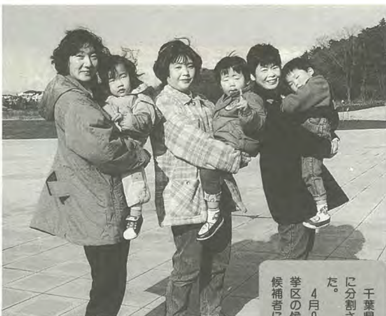
大切にしたい、私たちの一票

千葉県議会議員選挙の松戸市の選挙区が南・北に分割され、支所管轄により区域が定められました。 4月9日の選挙では、南選挙区の有権者は南選挙区の候補者に、北選挙区の有権者は北選挙区の候補者に、それぞれ投票することになります。