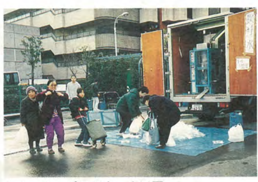
ウォーターパック車 大活躍 川や池の水から1分間に20ℓの飲料水をつくれる、 移動式では国内4自治体にしかない連続自動給水車が 現地で大活躍。被災者に喜ばれています。

市では、義援金受付本部を設置し、4月14日(金)まで援護課と各支所の窓口で、義援金の受け付けを行っています。 これまでに皆様から87,476,556円(2月9日(休)現在)の義援金をお寄せいただきました。ありがとうございます。 集められた義援金は、日本赤十字社および共同募金会などを通して、兵庫県災害対策本部へ送られています。 引き続き温かいご援助をお待ちしています。 ☎援護課