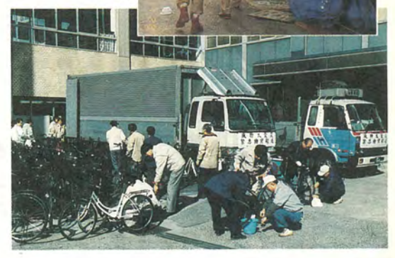
再生自転車150台を被災地に寄贈 被災地の復興の足に役立てると、市のシルバー人材センターのお年寄り と県自転車軽自動車商協同組合が整備と点検に協力。 現地への輸送には県トラック協会松戸支部と松戸商工会議所交通業部会が当たって、兵庫県に送られました。