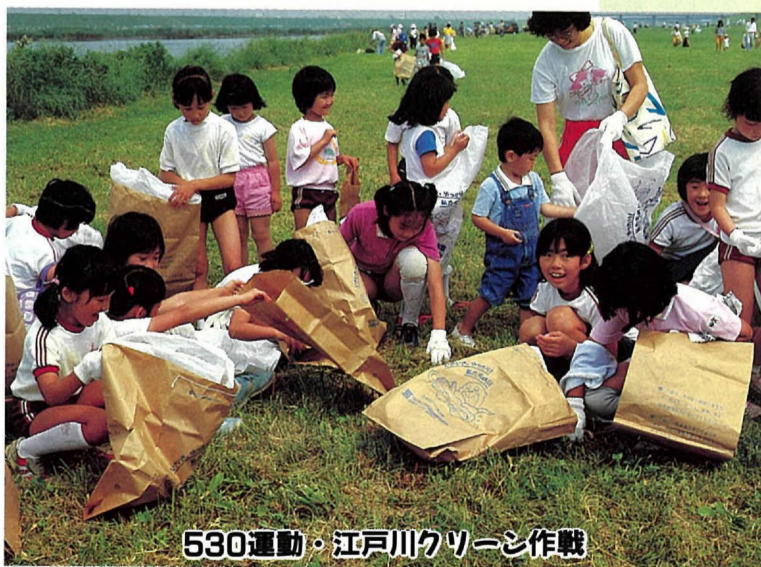
530運動・江戸川クリーン作戦

きれいな街をつくる市民運動は、着実にその輪を広げています。昨年は、市内全域で約18トンのゴミが集まりました