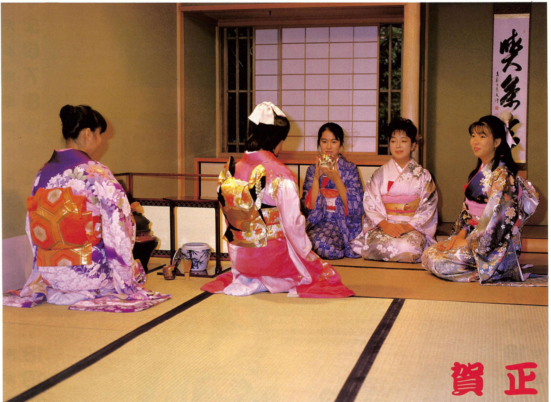
市民の芸術文化活動に広く利用される松雲亭(お茶会)