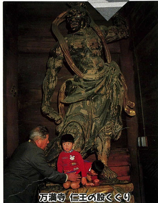
万満寺 仁王の股くぐり

国の重要文化財に指定されている金剛力士像(仁王)の股をくぐり抜けると、病魔や災いから身を守ることができるといわれています