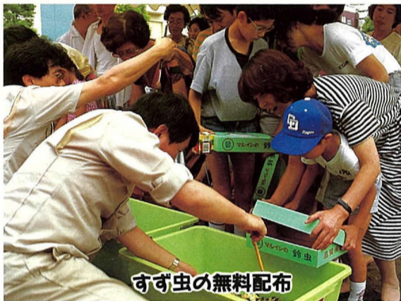
毎年心待ちにする市民も多いすず虫の無料配布。秋には涼しい鳴き声を聞かせてくれます