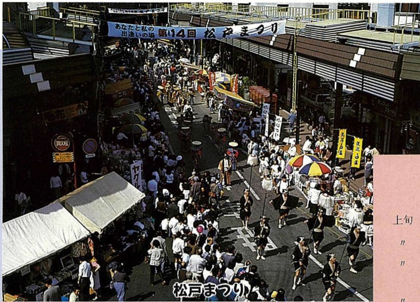
松戸駅周辺で開催される松戸市民のお祭り。昨年からは「大名行列」も復活して、大きな呼び物になっています