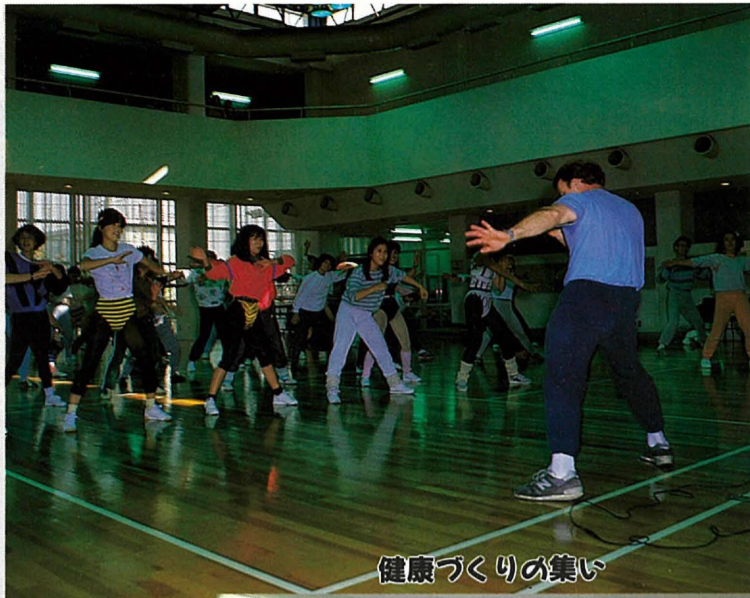
健康づくりの集い

市民健康づくりの集いも今年で十年目。市民の健康維持・増進のため、全市をあげての催しです。