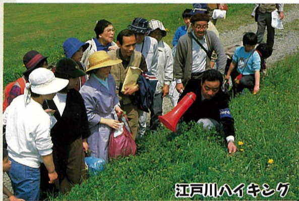
江戸川ハイキング

桜の開花時期に合わせて常盤平と六実で開かれ、たくさんの市民でにぎわいます。常盤平のさへら通りは建設省の日本の道百選に選ばれています