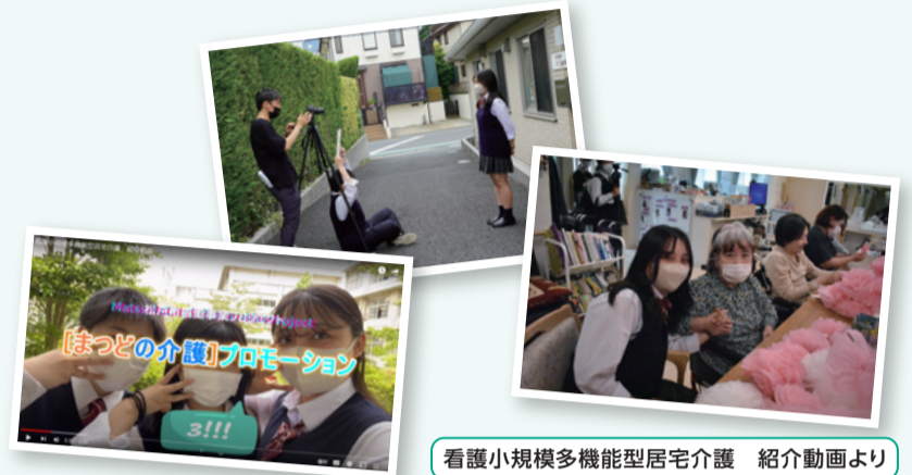
看護小規模多機能型居宅介護 紹介動画より

松戸市の皆さんに介護のことをもっと知ってもらうために、動画の撮影や編集のボランティアをしています。撮影は、介護施設の雰囲気や介護の仕事の魅力をわかりやすく伝えるにはどうしたらいいか、みんなで意見を出し合いながら楽しく行っています。