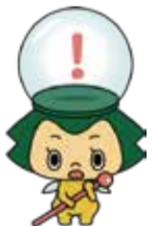
市公式ホームページの妖精「まつまつ」