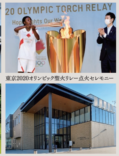
東京2020オリンピック聖火リレー点火セレモニー