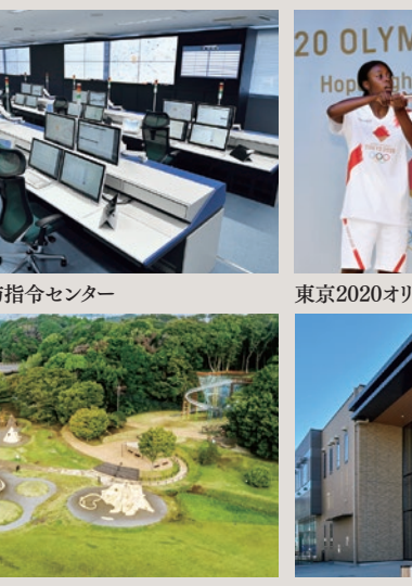
ちば北西部消防指令センター