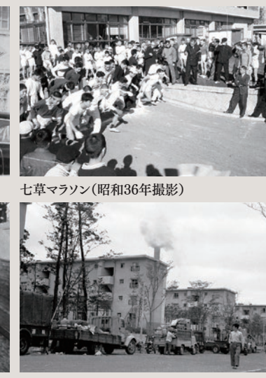
七草マソン(昭和36年撮影)