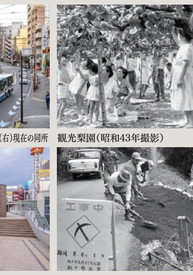
東松戸複合施設「ひがまつテラス」