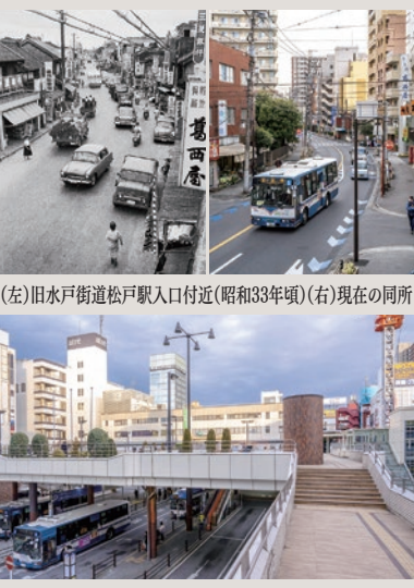
(左)旧水戸街道松戸駅入口付近(昭和33年頃)(右)現在の同所