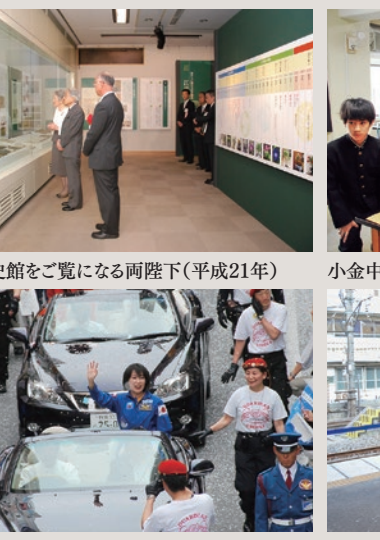
戸定歴史館をご覧になる両陛下(平成21年)