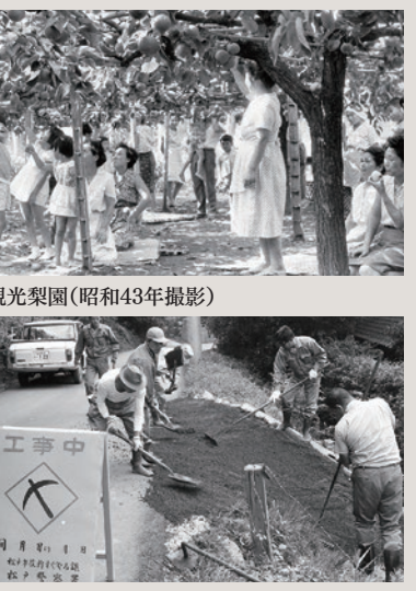
観光梨園(昭和43年撮影)