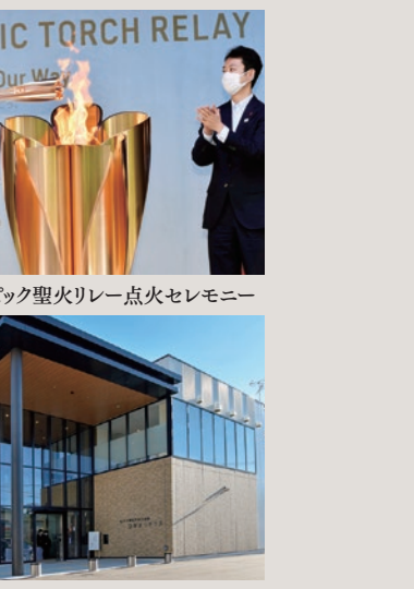
東京2020オリンピック聖火リレー点火セレモニー