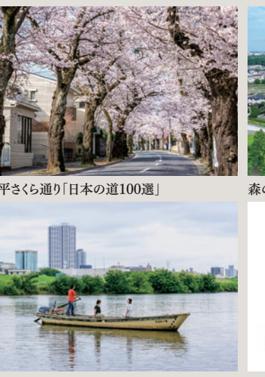
常盤平さくら通り「日本の道100選」