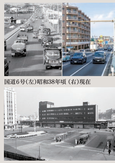
国道6号(左)昭和38年頃(右)現在