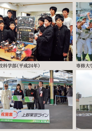
小金中学校科学部(平成24年)