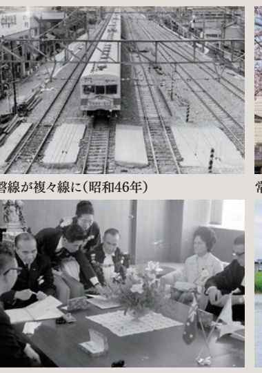
常磐線が複々線に(昭和46年)