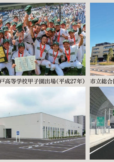
専修大学松戸高等学校甲子園出場(平成27年)