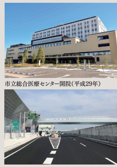
東京外環松戸インターチェンジ