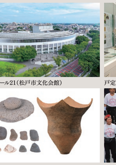
森のホール21(松戸市文化会館)