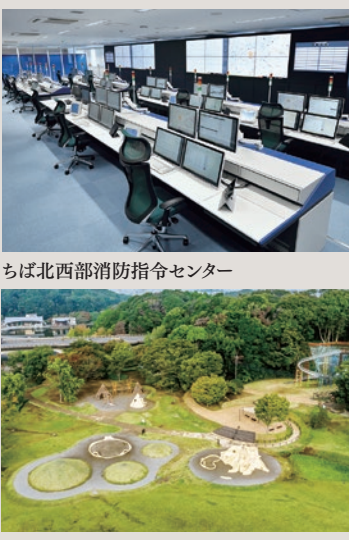
ちば北西部消防指令センター