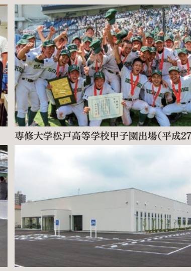
市民交流会館「すまいる」