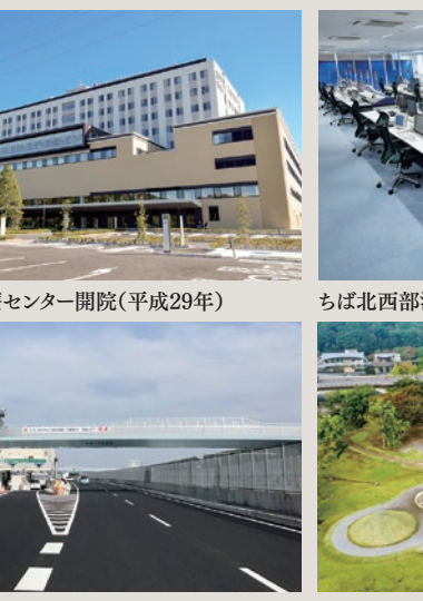
市立総合医療センター開院(平成29年)