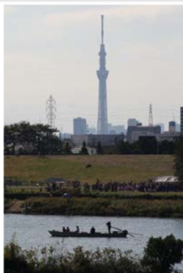
アンケート結果【矢切の渡し】の参考イメージ(残したい日本の音風景100選・江戸川唯一の渡し船)