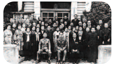
松戸町職員集合写真(昭和18年) 松戸市立博物館所蔵