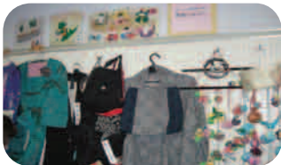
3R (リデュース・リユース・リサイクル) を実践したアイデア作品