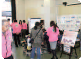
太陽光発電のしくみ を楽しく学ぼう！