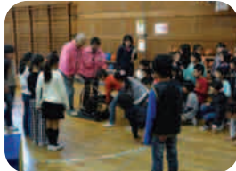
「パワー君」で発電体験！ エコ実験で遊ぼう！