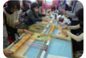
ケナフで織物体験！ 絵手紙を描いてみよう！

松戸市が進める地球温暖化対策“減CO2 (げんこつ) 大作戦” 地球にやさしい体験ブースでエコについて楽しく学んじょう！ 千葉大学環境ISO学生委員会も発表します！