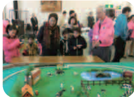
「電車でゴー！」手回し発 電で電車を走らせよう！