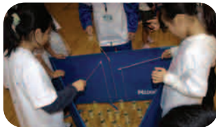
ペットボトル等身の回りにある 不用品を再利用したゲームで遊ぼう!!

もったいない運動協賛団体の活動に関する展示やもった ないアイデア作品の展示を行ないます。