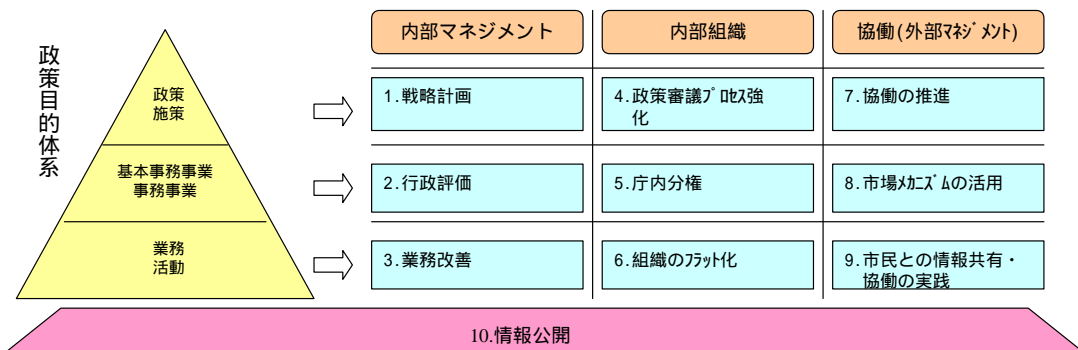
図2：行政経営システムの全体像

市役所の構造的な転換を図る方策の立案を行うため、本市の行政経営システムの全体像を次の図2のように整理しました。これは、行政経営を「内部マネジメント」「内部組織」「協働(外部マネジメント)」の3つの視点に切り分け、それぞれを「政策・施策レベル」「基本事務事業・事務事業レベル」「業務・活動レベル」の3つのレベルに細分化してできた9つの領域とそれらを支える仕組みとしての「情報公開」を加え、10の改革項目を導き出しています。このように、行政経営システムの全体を鳥瞰した上で、10の改革項目ごとに具体的手段や役割を明確にした工程表を作成し、個々の改革の関連を明確にするようにしています。