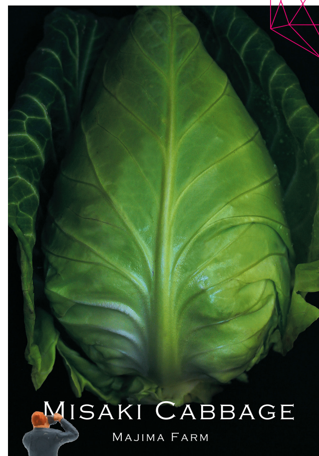
MISAKI CABBAGE MAJIMA FARM

松戸にも、色々な名所、旧跡、名物があります。 ガイドブックもたくさん出ていますが、野菜にはなかなか注目していなかった気がします。 でも、どうでしょう？こうしてあらためて観てみると「野菜は松戸の素晴らしいコンテンツかもしれない」と思えてきます。 もっと野菜を見直そう。 もっと野菜を好きになろう。 そんなふうに松戸野菜を応援しよう。 野菜が元気な街は、きっと素敵な街だと思っています。