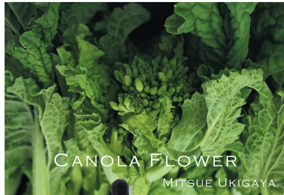
CANOLA FLOWER MITSUE UKIGAYA