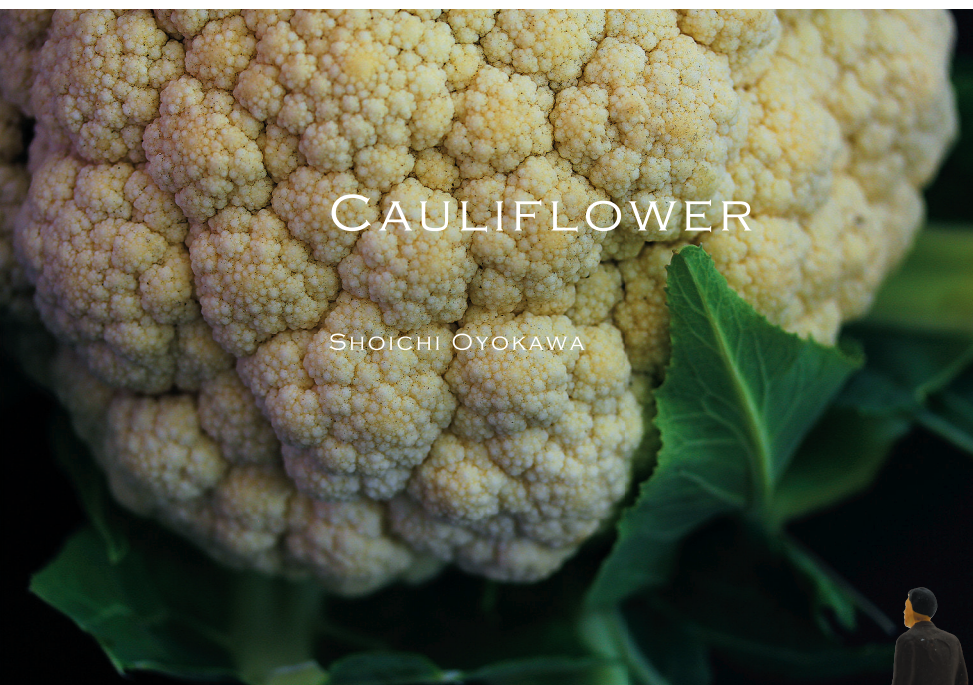
CAULIFLOWER SHOICHI OYOKAWA