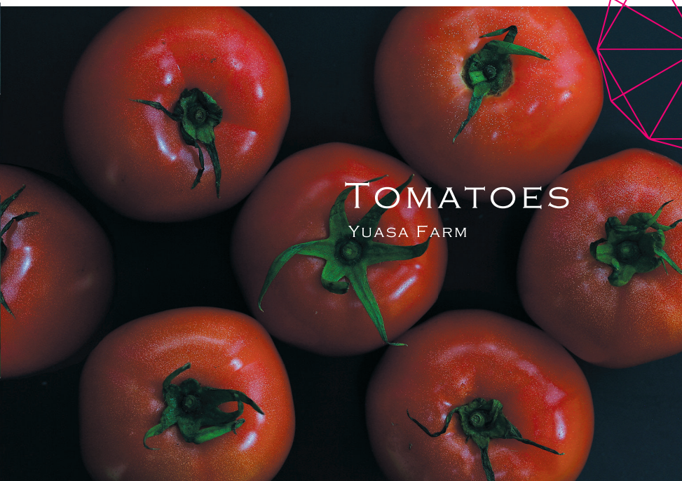
TOMATOES YUASA FARM