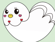
松戸市虐待防止推進 キャラクター「ハートはと」