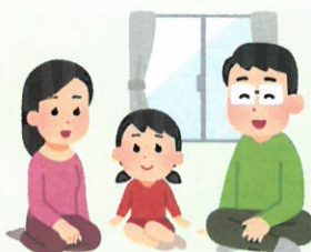
■市の虐待通告(通報)受理件数

市の虐待通告(通報)受理件数は、児童・高齢者・障害者、全ての分野で増加傾向にあります。少子高齢化、核家族化が進む中、家族の問題は複雑化し、介護が必要な家庭での子育て、障害を持つ人による高齢者介護など、一つの分野では対応が困難な場合があります。そのような問題を家族だけで抱え続けていると虐待が起こる可能性があります。みんなで地域や関係機関の支援を受けることにより、虐待を防いで、安心して子育てや介護ができる「虐待のない誰もが安心して暮らせるまちまつど」を目指しましょう。