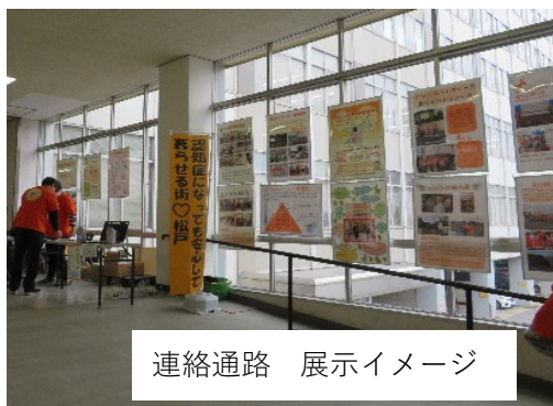
連絡通路 展示イメージ