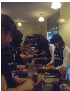
マレーシア研修にて コンピューター作り体験