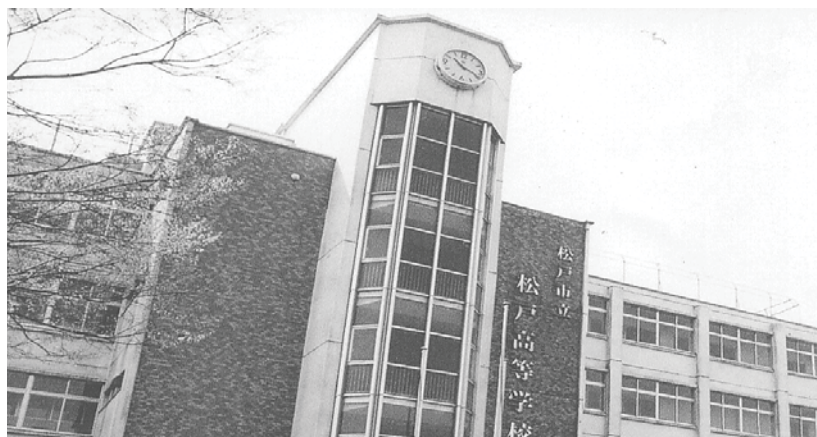
[市立松戸高等学校の概況]

生徒会を中心とした特別活動も盛んで、学校行事への生徒の主体的な取り組みが多く見られます。体育祭、文化祭、中学生対象の学校説明会の運営は、すべて生徒が行っております。