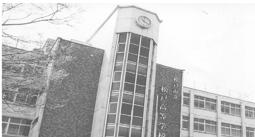
〔市立松戸高等学校の概況〕

生徒会を中心とした特別活動も盛んで、学校行事への生徒の主体的な取り組みが多く見られます。体育祭、文化祭、中学生対象の学校説明会の運営は、すべて生徒が行っております。