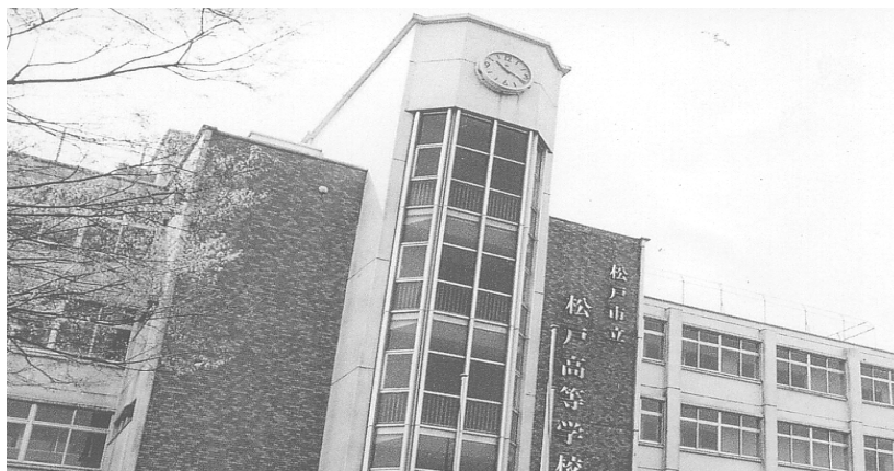
〔市立松戸高等学校の概況〕

卒業後の進路については、概ね4年制大学、短期大学、専門学校、就職等です。なお、大学等への進学率は約78%（平成21年度卒業生）に達しており、今後さらに進路指導の充実を図ります。