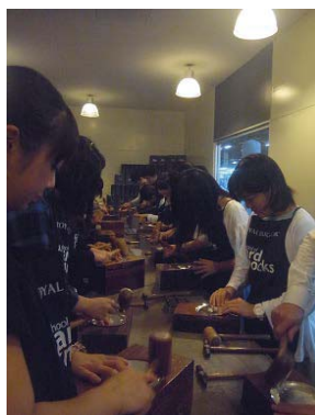
マレーシア研修にて コンピューター作り体験