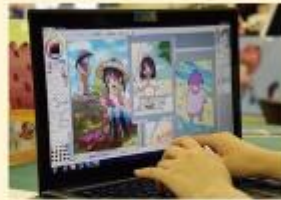
絵札のデザインは、松戸市の食育キャラクター「ぱくちゃん」と暮らす家族のイメージを作り、読み句に合わせて家族の日常を表現。