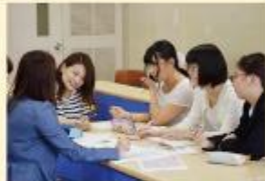
読み句を選定中。松戸の特産物、朝食摂取、食への感謝の気持ち、共食、食事マナー、消費など食に関する様々なことを取り入れました。