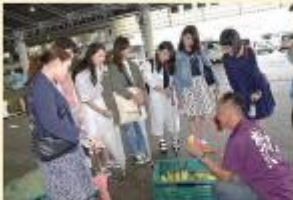
南部市場に取材。生産者から松戸の野菜について話を聞きました。