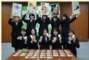
松戸市長より感謝状をいただきました。