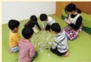
松戸市内保育所でかるた会！大人も子どももかるたに夢中。

読み札の裏には、解説が載っており、楽しく遊びながら食を学べるように、子どもも大人も楽しめる食育かるたを制作しましたので、ぜひ多くの方に遊んでいただきたいです。