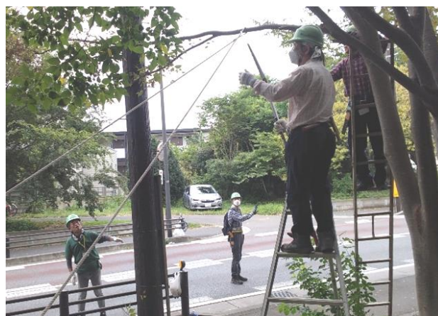
実地体験先の様子(里やま保全活動)