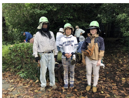
実地体験先での記念撮影