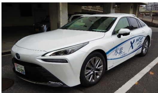
松戸市が導入している 燃料電池自動車