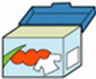
【においのついたもの】 × （洗剤の箱や線香の箱 など）