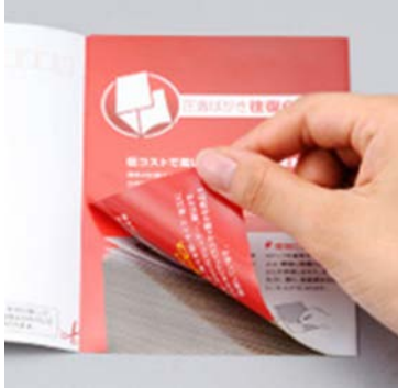
【圧着はがき、親展はがき】 × （見開きにして中を見るはがき）