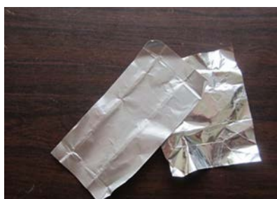
【アルミ、金紙、銀紙、ビニール でコーティングされた紙】 ×