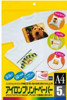
【アイロンプリント紙】 ×