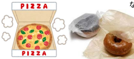
【食品や油で汚れたもの】 × （ピザの箱など） 【合成紙】 × （ドーナツの包装紙、クッキングシート など）