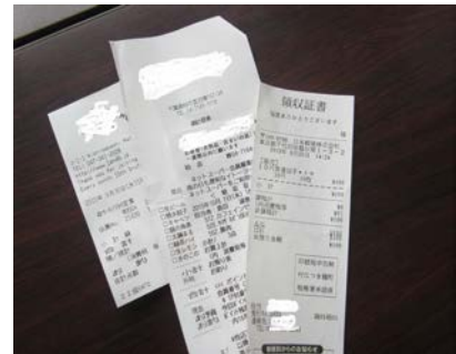
【感熱紙】 × （レシート、FAX ロール紙など）