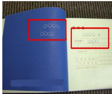
【カーボン紙、ノーカーボン紙】 × （宅急便の複写伝票など）