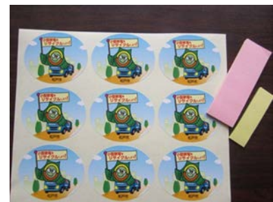
【シール、シール台紙、 粘着メモ（ふせんなど）】 ×