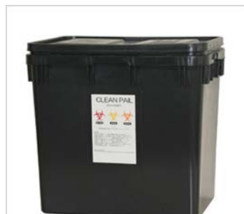
医療用廃棄物容器