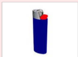
ガスライター (中身を残さない)