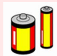
乾電池 (有害ごみと明記)