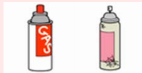
ガスボンベ・スプレー缶 (中身を残さない)