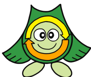
クリンクルちゃん

事業所から排出されるごみは、 事業者自らの責任において適正に処理しなければならない と法律で定められています。 正しく廃棄物を処理しましょう！