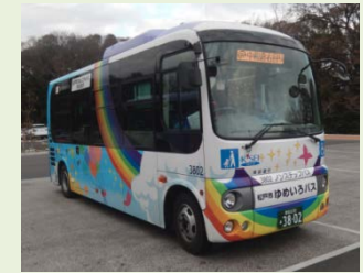
R5. 7 現在