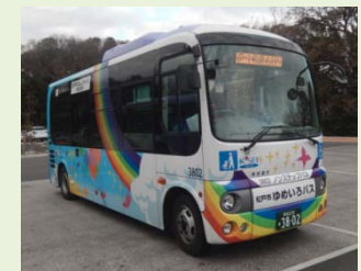
R5. 7 現在