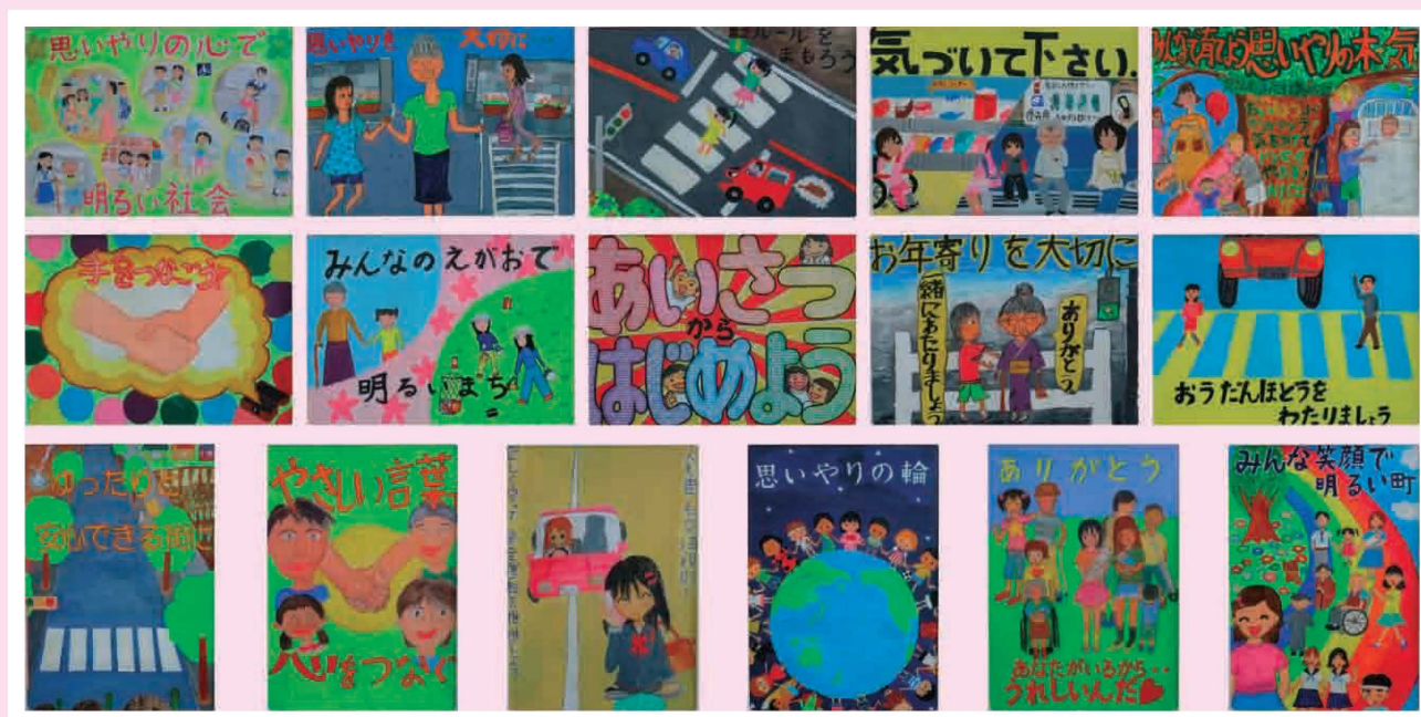
(2008年 明るい社会づくりポスターコンクール・入選作品)