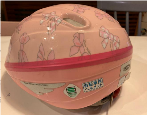
⑦幼児用ヘルメット全体及びSGマークの写真