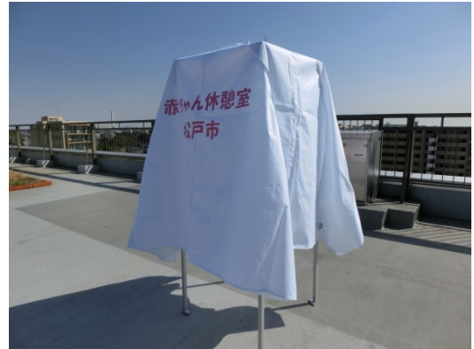
②骨組みの足を伸ばして天幕をかぶせます