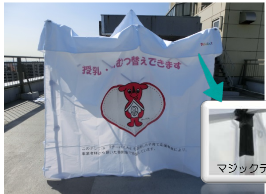
④横幕を内側からマジックテープで取り付け ます