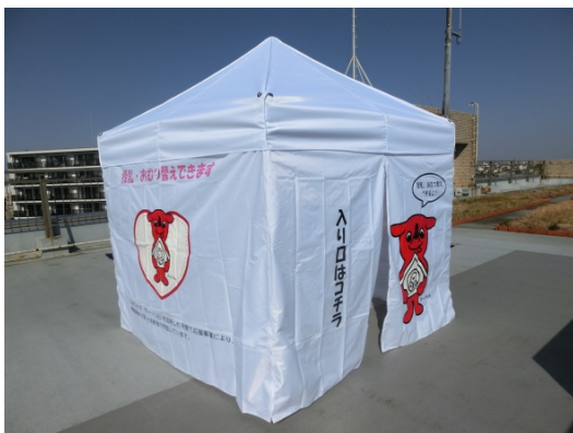
⑤完全に広げてから全てのマジックテープ をとめます ※重し又は杭で固定してください