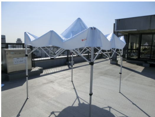
③骨組みを途中まで広げます ※完全に広げてしまうと作業しにくいです