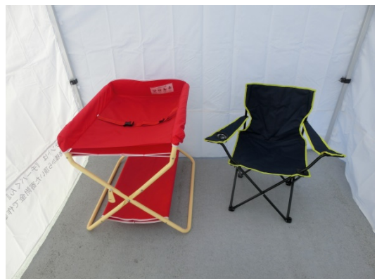
⑥テント内におむつ交換台、授乳用椅子を 設置してください ※ストッパーを忘れずに