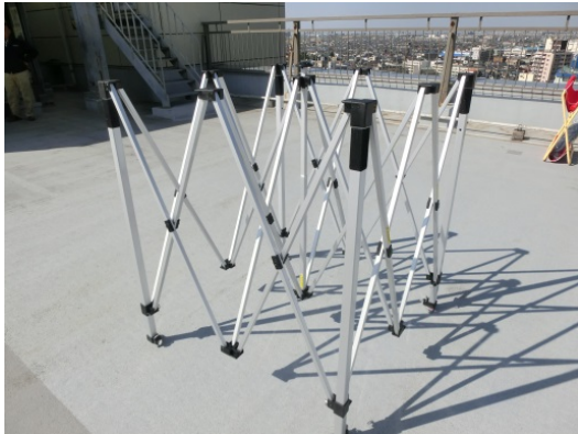
①骨組みを広げます