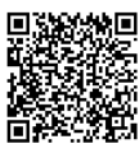
申請書ダウンロード