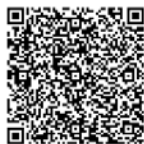
電子申請フォーム

令和5年度分の申請として、「松戸市オンライン申請システム」または「給食費等支援金支給申請書」により申請してください。