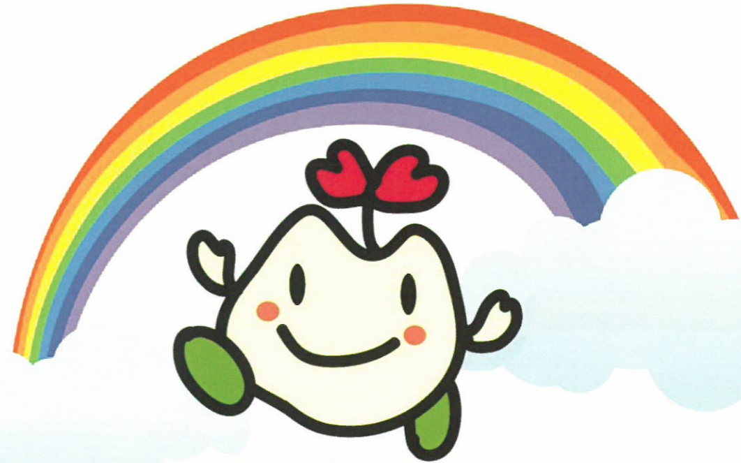
マスコットキャラクター まっころん

〒271-0094 松戸市上矢切299-1(総合福祉会館内) 〔URL〕 http://www.matsudo-shakyo.com/ 〔E-mail〕 kanri@matsudo-shakyo.com