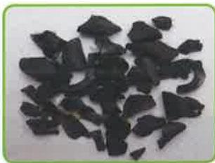
実際に見つかったゴムの混入物

製造過程でゴムは比重が塩ビと近く金属探知機にも反応しないため、除去が困難です。排出物に、 ゴム等が混入することの無いよう、周知徹底をお願いいたします。