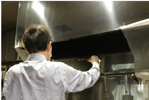
<換気扇付近の風量計測>