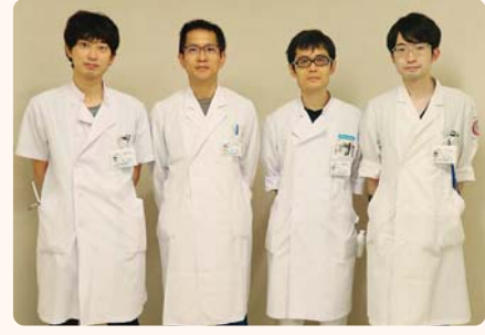
脳神経内科のみなさん

脳神経内科では、主に脳梗塞の急性期治療を行っています。発症後の超早期（発症してから4時間30分以内）では、点滴での血栓溶解療法（tPA）も積極的に行っています。その時間を過ぎて来院されたとしても、それぞれに患者さんの持病に応じながら最善の治療を行うようにします。そして治療をしながら、さまざまな検査（エコー検査など）を通じて、最適な再発予防を提供していきます。